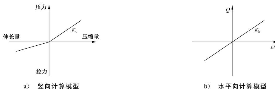
图 B.1 天然橡胶支座计算模型