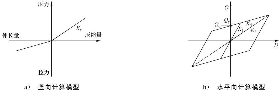
图 B.2 铅芯橡胶支座水平向计算模型

水平向力学模型采用双线性模型见图 B.2,恢复力曲线的大小和形状由屈服力,屈服前水平刚度和屈服后水平刚度确定。