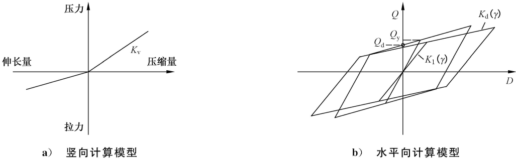
图 B.3 高阻尼橡胶支座水平向计算模型

水平向力学模型采用修正双线性模型见图 B.3,恢复力曲线的大小和形状由屈服力,屈服前水平刚度和屈服后水平刚度确定。屈服力,屈服前水平刚度和屈服后水平刚度随支座剪应变进行修正。